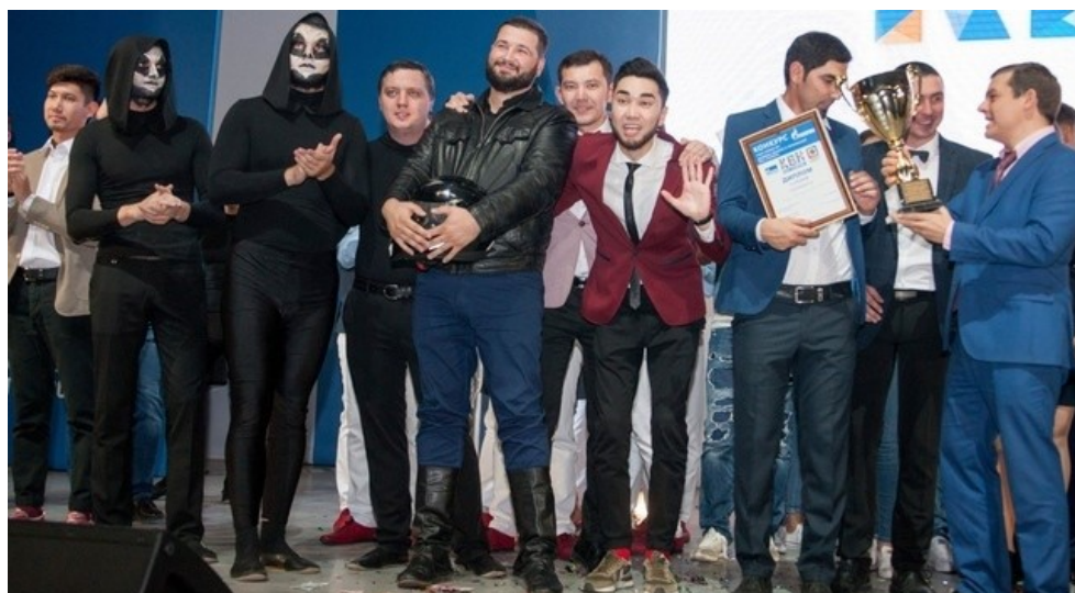
Фото: финал конкурса КВН ПАО «Газпром» 2017 года.

Итоговый протокол отборочного эта- па конкурса среди команд КВН дочер- них обществ ПАО «Газпром»: